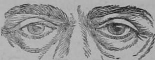
Recrecimientos debajo de los ojos y en las pantorrillas, piernas, brazos y abdomen. Significan hidropesía.

La congestión o inflamación de los riñones causa generalmente un dolor palpitante por detrás en la cintura, punzadas al empujarse o agacharse, dolor de espalda, luego es casi seguro que se desorganice la acción de los riñones y cause frecuentes orines, aunque sean pocos a la vez; se siente ardor y dolores, pesantez y los orines parecen fangosos, con sedimentos y de color obscuro. Cuando se interrumpe la circulación de la sangre, o se atrasa en parte, a causa de la inflamación de cualquier riñón, las sustancias tóxicas y venenosas el ácido úrico especialmente se acumulan en la sangre, y se hace imposible una buena salud. Con el tiempo el ácido úrico endurece las arterias, retrasa la circulación de la sangre y causa la hidropesía, (véanse los síntomas en el grabado) arenilla y otros graves males que pueden traer muy malas consecuencias.