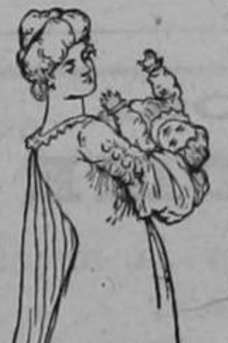
(Para la señora embarazada y para la madre q. está criando.)