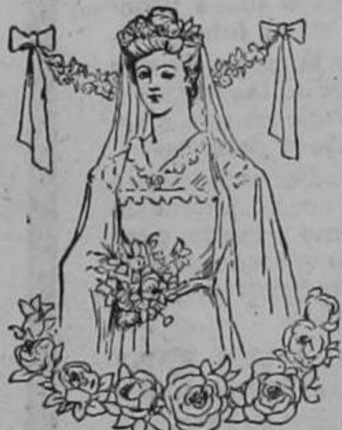
(Para las jóvenes débiles, nerviosas o demacradas.)

NOTA: Si estas son sus cualidades esenciales, ¿por qué no queda Ud. convencida como otras señoras y señoritas que han sentido sus beneficios, si Ud. también puede hacerlo como las demás? Además, es un remedio que tiene la propiedad de prevenir las enfermedades del sexo, antes que ellas puedan desarrollarse, combatiéndolas victoriosamente. Las señoras no deben olvidar que el Compuesto Mitchella, es un remedio inofensivo que propicia el feliz advenimiento del ser que aspiran las madres. No solamente contribuye al rápido y absoluto restablecimiento después del parto, sino que proporciona a la madre ponerla en condiciones de amamantar su niño ofreciéndole abundante alimento de su pecho. Comience cuanto antes la primera prueba y observe los resultados. Es de substancias vegetales y absolutamente inofensivas. Pídalo en las Boticas y Droguerías e insista en que el Sr. Boticario le dé el Compuesto Mitchella. DR. J. H. DYE MEDICAL INSTITUTE, Buffalo, N. Y., E. U. de A.