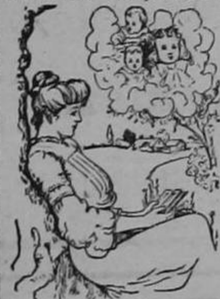
(Para la señora q. está entristecida porque le parece imposible ser madre.)

El Dr. H. R. Koen de la Facultad de Medicina de París, de Port-au-Prince, Rep. de Haití, CERTIFICA: "He prescrito a mis enfermas el Compuesto Mitchella habiendo obtenido admirables resultados en los siguientes casos: Para calmar los dolores frecuentes durante el embarazo y el parto, flores blancas, menstruación dolorosa y como tónico reconstituyente. Lo recomiendo a las señoras y señoritas q. sufren de iguales dolencias."