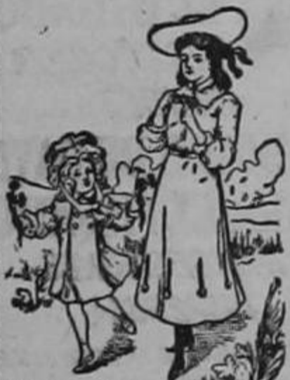
(Para las niñas q. comienzan a entrar en el estado de mujer)